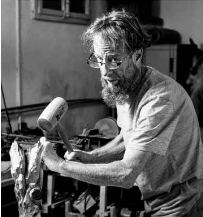
Bildhauen: In den Ferien ausprobiert – und eine Passion gefunden.