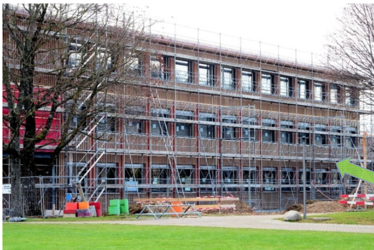
Modulschulhaus Neftenbach, Landbote 18.12.2019