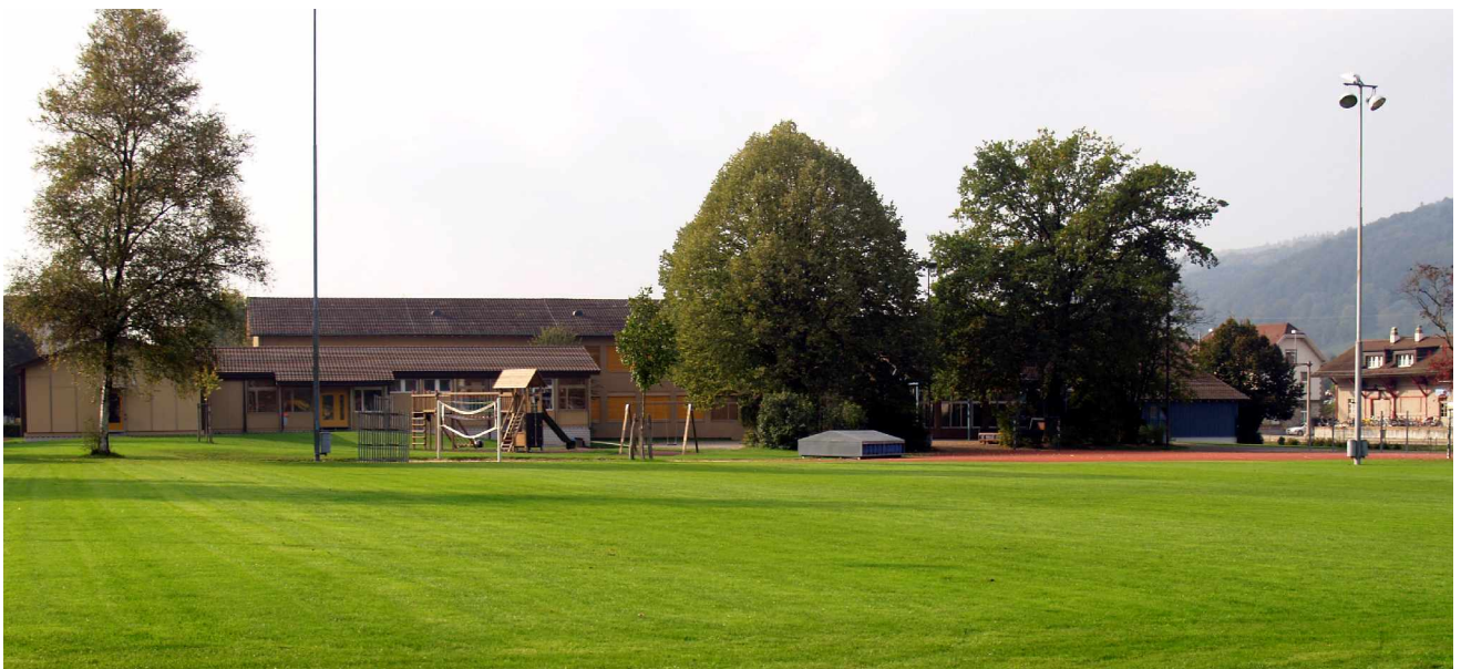
Schulhaus Breiteacker mit Turnwiese