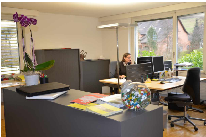
Das neue Schulsekretariat