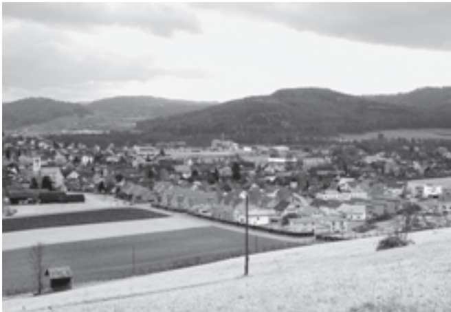
Neubaugebiet Chlimberg, Neftenbach

Dem Waldrand folgend erreichten wir den Wolschberg. Von hier führte dann der Weg leicht abfallend hinunter nach Buch. Obwohl unsere Gruppe mit den 23 Wanderern sich gemütlich vorwärts bewegt hatte, waren wir vor den fünf Frauen der Gruppe zwei in der «Sonne» in Buch. «Metzgete» lasen wir auf dem Schild vor der Wirtschaft, ein reichhaltiges Angebot an diversen Speisen stand zur Wahl, so dass jeder etwas finden konnte. Leider konnten nicht alle gleichzeitig bedient werden, die Kapazität des Kochherdes war anscheinend begrenzt. Dafür schmeckte das Essen dann umso besser und zu wenig bekam niemand.