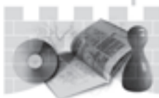
Gemeinde- und Schulbibliothek Pfungen